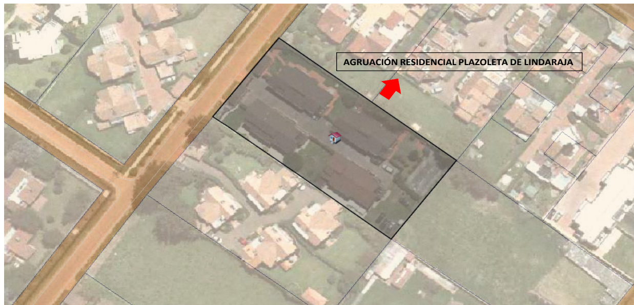
Imagen N° 1. Ubicación Agrupación Residencial Plazoleta de Lindaraja